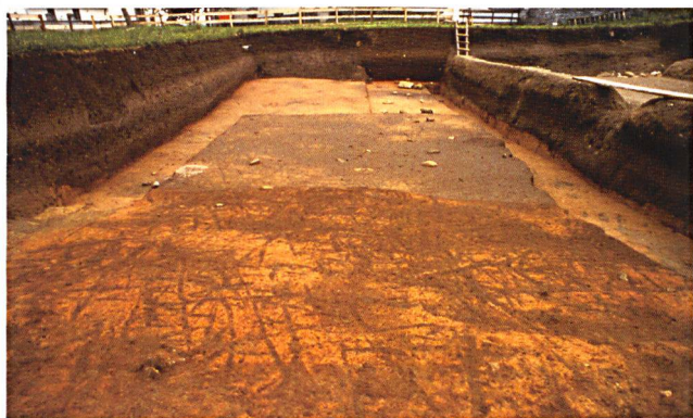
5 Tracce d'aratura attribuibili all'età del Rame, emerse a Castaneda-Pian del Remit

tra scheggiata del Neolitico e dell'età del Rame. È probabile che le necropoli furono allestite in un luogo frequentato millenni prima da gruppi neolitici.